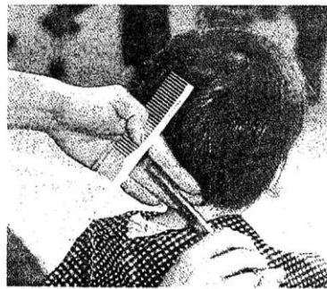
両サイドと下を切ってから、角を丸く仕上げると「かわいらしく見えます」