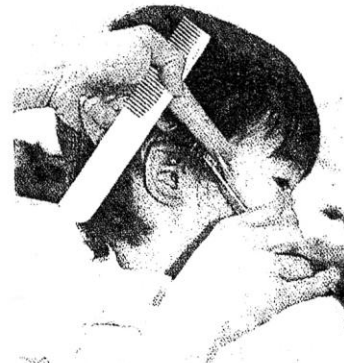
耳の周りは毛を指で挟み、指の腹にハサミを当てカットする

前髪 —— 額を底辺にして「三角ベース」形に前髪を整え、それ以外の髪をピンでとめる。仕上がりの長さをまゆ毛の下などを目安に決め、髪少量を指の間に挟み、切り落としたい部分にスキバサミを入れる。刃先で2、3回切ると自然な感じに仕上がる。