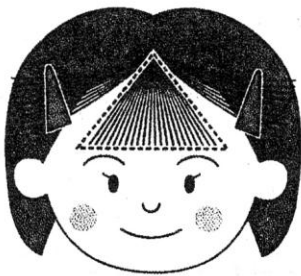
前髪は「三角ベース」形に整え、ほかの髪は間違えて切らないようにピンで留める

用意するものは散髪用のスキバサミと目の細かいクシ。切った髪を受ける専用ケープもあれば便利です。どれも100円ショップで買うことができます。初心者でも失敗しない秘密道具がスキバサミ。本来は髪をすくためのハサミだが髪を切り過ぎる恐れはなく、1回に切れる髪は少量なので、2、3回連続して刃を動かすのがポイントです。