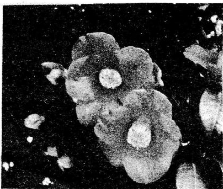
ヤブツバキ。八重咲きのは、サザンカとの交雑種のカンツバキ。